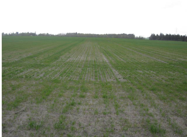
Billede 2. Angreb af havrecystenematoder i en havremark. Hvor jorden er mest fast, vokser planterne bedre, hvilket tit ses ved angreb af havreål.

Kontakt din lokale rådgivningsvirksomhed , hvis du vil vide mere om dette